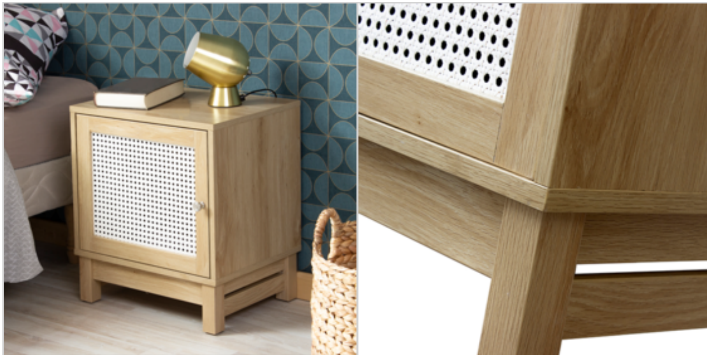
Table de chevet 1 porte avec charnières façade imitation rotin ECOPART : 0.47€ HT