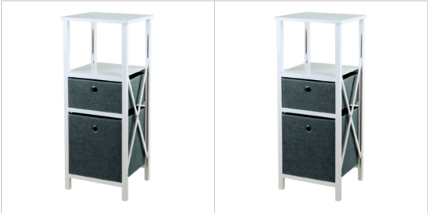
MEUBLE PLIABLE BLANC 2 TIROIRS GRIS